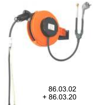
86.03.02 + 86.03.20