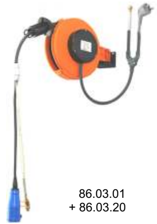
86.03.01 + 86.03.20