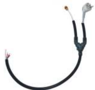
86.03.11 + 86.03.20