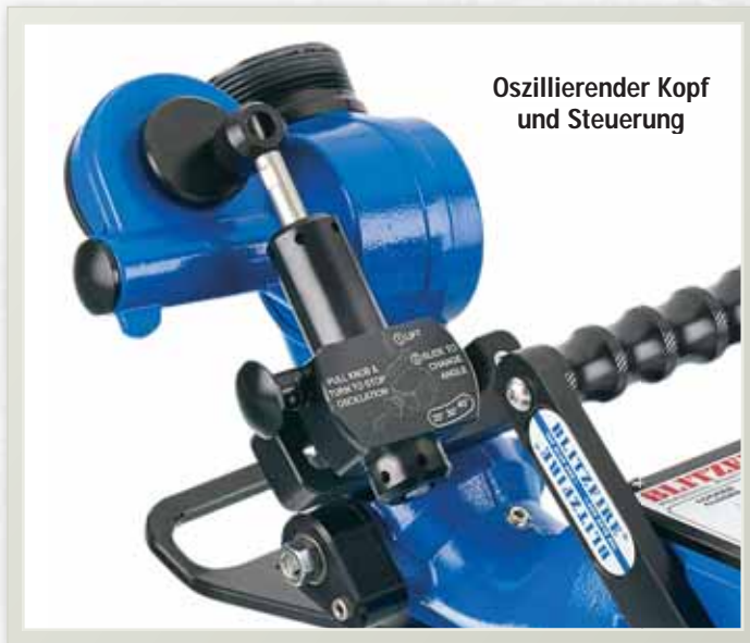
Oszillierender Kopf und Steuerung

Tragbarer oszillierender Monitor mit hoher Hubhöhe