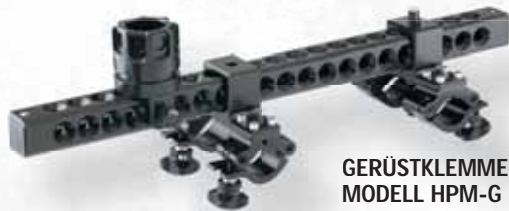
GERÜSTKLEMME MODELL HPM-G

I-TRÄGER KLEMME FUNGIERT AUCH ALS 2-ZOLL KUPPLUNGSHALTERUNG