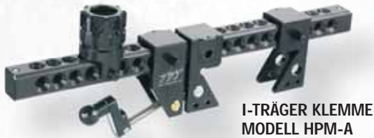
I-TRÄGER KLEMME MODELL HPM-A

Innerhalb von Minuten kann eine Person die Hemisphere-Klemmen sicher an I-Trägern, Geländern, Behälterlippen, Bäumen/Stangen/Pollern oder sogar 2-Zoll Kupplungen befestigen und eine Wasserabgabe von 2000 l/min am Brandort oder an vorher geplanten Standorten herstellen, die Bodenmonitore nie abdecken könnten.