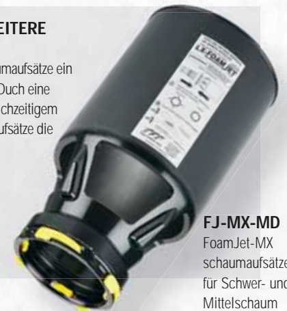
FJ-MX-MD FoamJet-MX schaumaufsätze für Schwer- und Mittelschaum