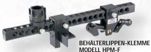
BEHÄLTERLIPPEN-KLEMME MODELL HPM-F

PASST AUF INDUSTRIEGELÄNDER UND OSHA-GERÜSTE