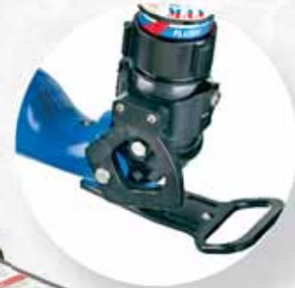
Einzigartiges-doppeltes Kugelzapfen Design

Die viel größere Erhöhung kann taktische Vorteile bieten, wie die Möglichkeit, einen hochvolumigen Strom direkt über Kopf zu platzieren oder das Rohrleitungssystem zu erreichen, das direkt vor Ihnen ist, das einfach irgendwie außer Reichweite ist. Was auch immer Sie benötigen, TFT hat genau das Richtige für Sie.