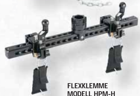
FLEXKLEMME MODELL HPM-H

KLEMMT SICH SICHER AN LIPPEN VON MINERALÖLBEHÄLTERN